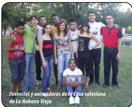
Juveniles y animadores de la Casa salesiana de La Habana Vieja