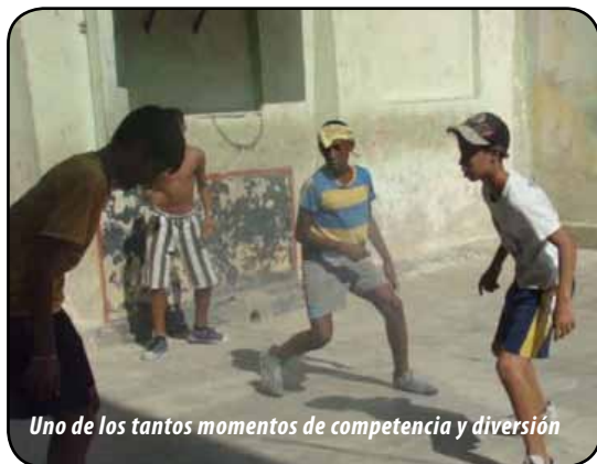
Uno de los tantos momentos de competencia y diversión

La Habana, 6 de diciembre. - Diez equipos compuestos de cuatro jugadores se dieron cita para el torneo navideño del Oratorio de María Auxiliadora, según el método todos contra todos a ganar el mejor. Día tras día se vieron grandes espectáculos y una gran rivalidad entre los equipos, especialmente entre los equipos 1 y 2, este último se coló contra todo pronóstico en la disputa de los primeros lugares.