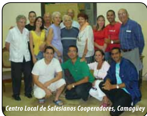
Centro Local de Salesianos Cooperadores, Camagüey

y rediseñando las presencias (CG26, núcleo 5, Nuevas Fronteras). Se sugirió también asegurar la armonía entre la identidad carismática y la pasión apostólica viviendo la mística del “da mihi animas, cetera tolle”: el retorno a Don Bosco y la vivencia de la pobreza evangélica (CG26, núcleos 1 y 4). En la carta del Rector Mayor además se hace énfasis en la necesidad de fortalecer la Pastoral Juvenil y dentro de ella desarrollar la Pastoral Vocacional: la urgencia de evangelizar y la necesidad de convocar (CG26, núcleos 2 y 3). Por último se refiere a la importancia del cuidado de la formación continua (inicial y permanente).