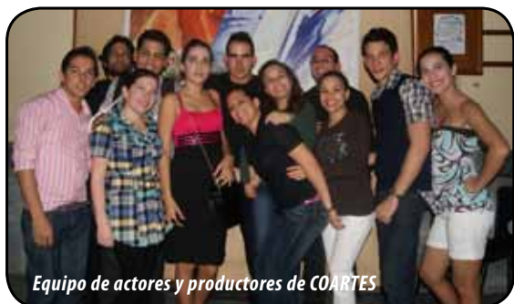
Equipo de actores y productores de COARTES