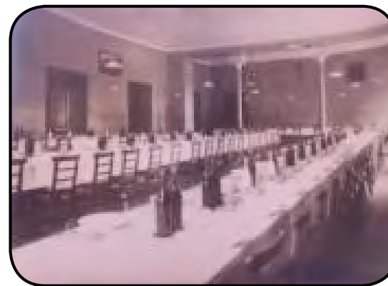
Comedor del Oratorio de Crocetta

Días después viajamos a Turín-Crocetta, donde entre los años 1932-1936 el padre Vandor realizó sus estudios teológicos. Allí llegamos con análogas esperanzas.