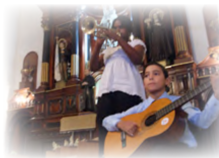
Niños participan en festival Juan Soñador

En la noche se celebró el Festival de Arte "Juan Soñador". Un espacio donde diferentes grupos de la comunidad y artistas invitados de la ciudad presentaron