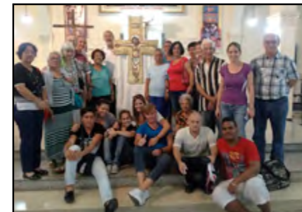
Representación de la comunidad de La Víbora