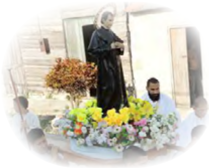
Procesión de la imagen de Don Bosco en Manzanillo

En Santa Clara , las actividades comenzaron con un triduo de preparación animado por varios grupos de la Familia Salesiana, donde cada día reflexionaron sobre las ideas centrales del aguinaldo que el Rector Mayor propuso para este año: "Con Jesús, recorramos juntos la aventura del Espíritu". El sábado, a la hora de la catequesis infantil, el parque del Carmen fue invadido por un centenar de niños con sus catequistas y animadores. Junto a los muchachos del barrio, y los de la Catedral de Santa Clara, los niños del Carmen realizaron un partido amistoso