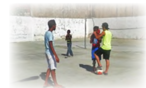
Fiesta en el oratorio de Santiago de Cuba

rio de la Capilla San Vicente de Paúl. Entre dinámicas, juegos y canciones los infantes dedicaron la mañana a conocer más y celebrar la fiesta de un amigo muy especial que disfrutaba jugando y enseñando a los niños pobres. Ese mismo día en la noche, niños, jóvenes y otros miembros de la comunidad, se reunieron en la iglesia de La Caridad para dedicar un momento cultural a Don Bosco. Los invitados especiales de la gala fueron el Ballet Folklórico de Camagüey, con sus representantes más