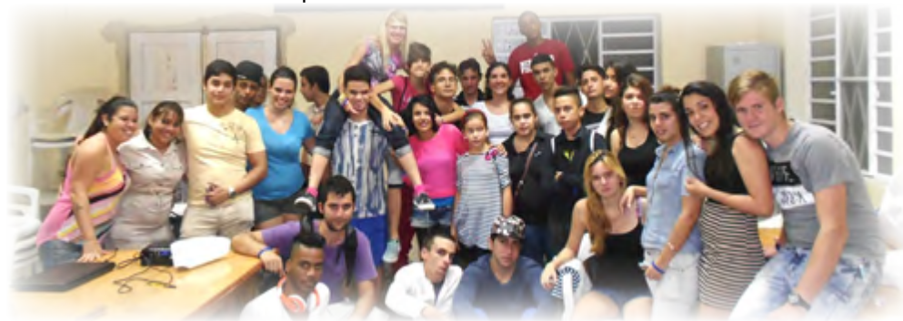
Grupo de jóvenes de La Víbora

Estas y otras actividades se realizaron por toda Cuba uniéndose a las celebraciones por la presencia en todo el mundo de Don Bosco. El santo de la alegría, que hacía magia y acrobacias; el que era profundo con el joven y el niño, al mismo tiempo; el que gastó su vida por los que no tenían casa ni escuela ni trabajo en la Italia del siglo XIX. Un soñador. Un loco, que como Jesús, lo dio todo, y hoy nos invita a recorrer juntos la aventura del Espíritu.