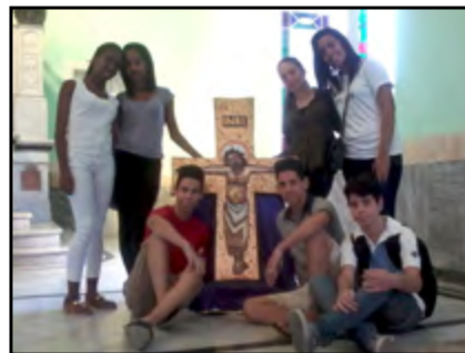
Jóvenes del Santuario Nacional de María Auxiliadora

La Habana.- Como iniciativas y para animar a que participen los jóvenes, por las diferentes iglesias de La Habana, comenzó la peregrinación de la cruz que bendijo el Papa Francisco en su visita al país el 19 de septiembre del 2015, y que acompañará las actividades en julio. En la mañana del domingo 14 de febrero el grupo de jóvenes del Santuario Nacional de María Auxiliadora, en La Habana Vieja, recibieron la cruz de la Jornada.